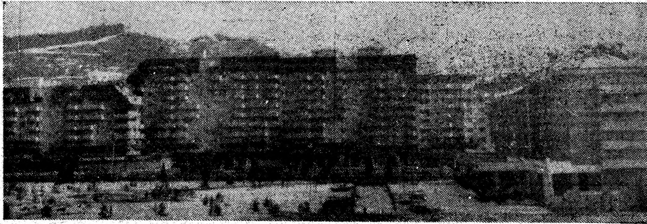
Imagine panoramică a cartierului „Hermes” din reședința de municipiu.