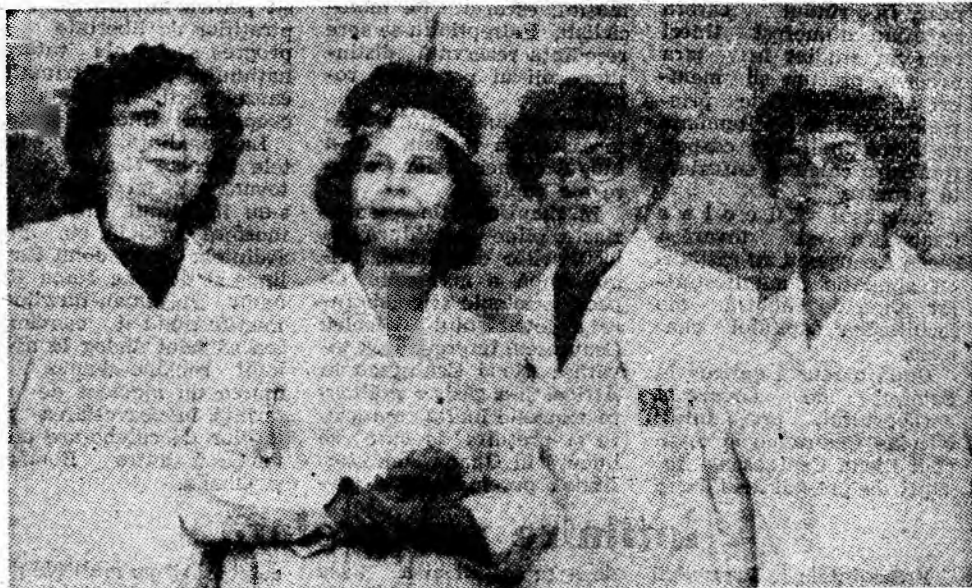
Oameni în halate albe, care veghează la sănătatea semenilor.