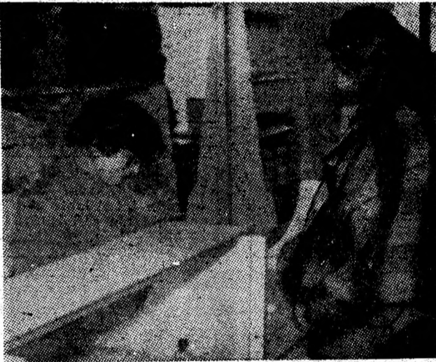
Aspect din noua unitate de mercerie deschisă în cartierul Petroșani-Nord.

Prin urmare pentru realizarea cantităților planificate de cărbune pentru cocs trebuie eforturi sporite, comune ale minerilor și preparatorilor atît pentru realizarea producției planificate cît și pentru încadrarea strictă în conținutul de cenușă stabilit.