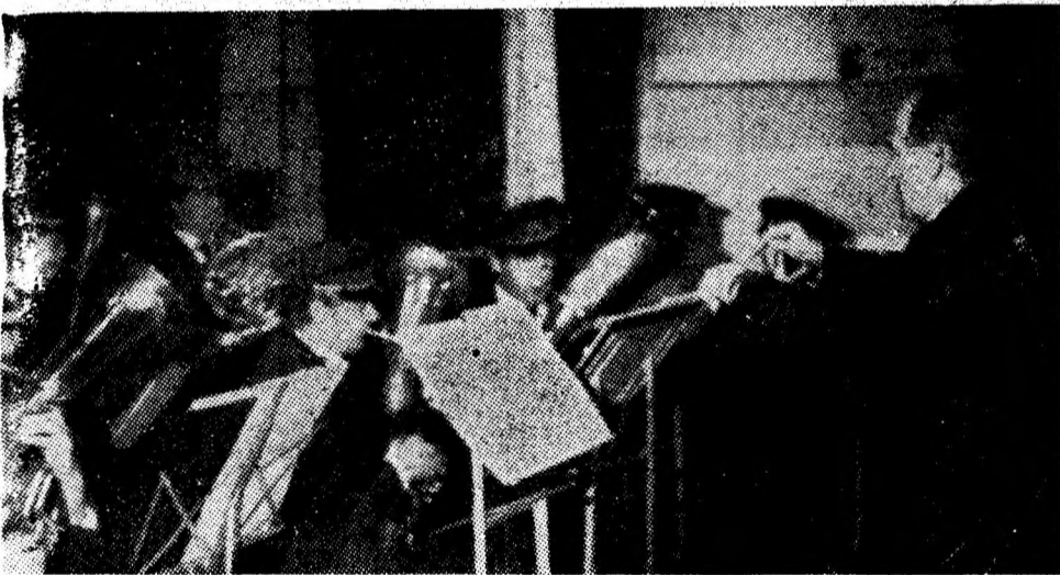
40 de ani de la înființarea Teatrului de stat „Valea Jiului”