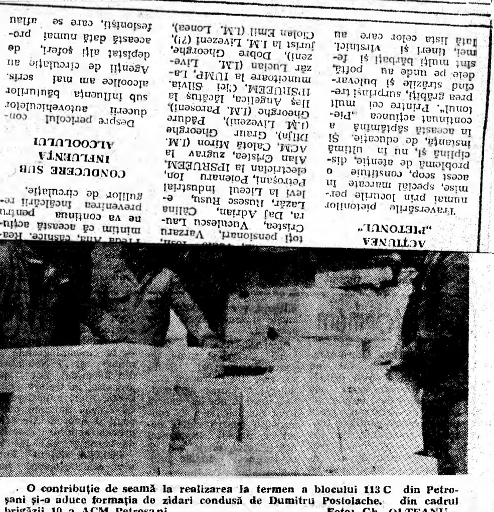
O contribuție de seamă la realizarea la termen a blocului 113 C din Petroșani și-o aduce formația de zidari condusă de Dumitru Postolache, din cadrul brigăzii 10 a ACM Petroșani.