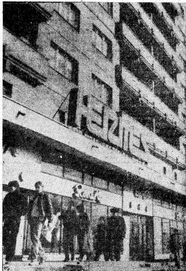
Imagine cotidiană din reședința de municipiu: cartierul „Hermes” cu noile sale spații comerciale.

• Cronicile meciurilor de fotbal din campionatul diviziei B • Clasamente • Lupte, divizia A • Notă: Situații și... complicații.