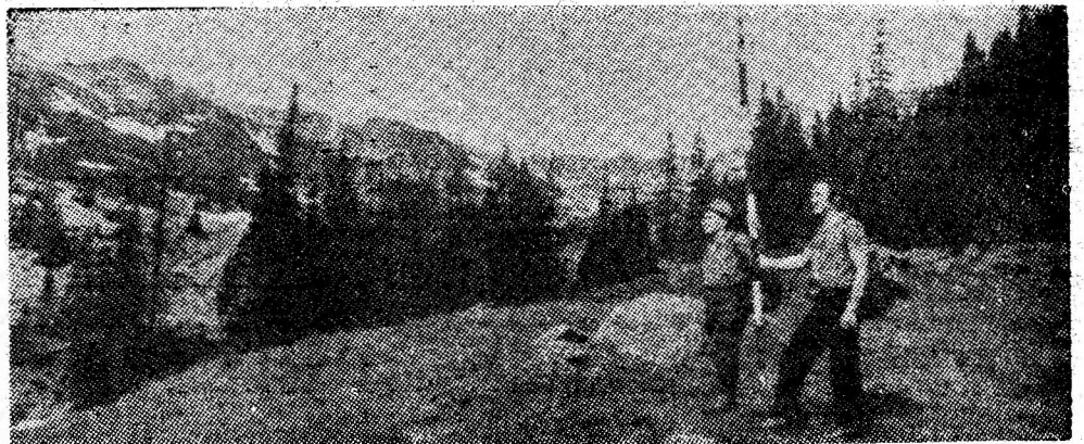
Spre înălțimile Paringului.

Ne întâmpină mirificul spectacol al culorilor și mișcărilor vegetației luxuriantă, un „paradis al florilor”. În stînga și în dreapta cărării ce urcă pieptiș, paralel cu pîrîul Roșii spre treptele glaciare ale căldării, ne însoțesc picururile jnepenișului, ale scorușului în floare. Covorul pajistii proaspete este presărat cu gin-gașele, dar cu atât mai incântătoarele găbenele de munte, degetăruțul pitic, cu clopoței minusculi și de un mov discret, ca și cel al stelutețelor „ochiului găinii”, cu dedeții, romanițe și clopoței de munte, ghințura galbenă și multe, multe altele. Florile poartă cu ele solia luminii și căldurii cerului albastru, a naturii renăscute. Pe abrupturile versanților, printre grohotișuri și petele de zăpadă ascunse în