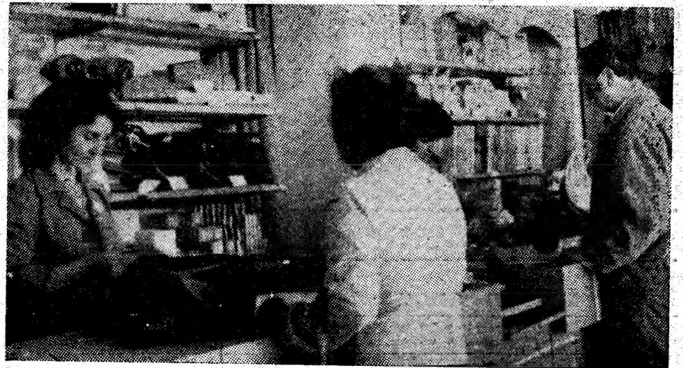
Servire civilizată în unitatea nr. 373 „Electrice” din Uricani (responsabilă Valeria Danciu și Florin Floarea, vânzătoare).