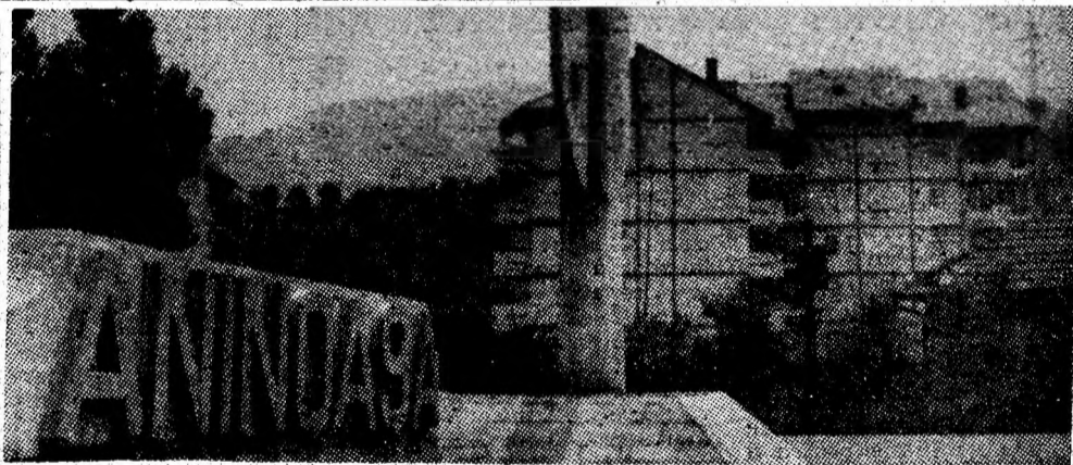
Un modern cartier de locuințe prinde contur în Iseroni, datorită deschiderii noii mine, a doua unitate extractivă a comunei Aninoasa.

Așadar, din pricina a patru posturi (cite mai lipsesc, în medie, la puțul orb nr. 6), se pierde o producție de aproape 200 tone de cărbune pe zi, deci, calculat la productivitatea muncii din sectorul III, în jur de 110 posturi. Pagubă e prea mare, ca să nu mai vorbim de formațiile de mineri, puse în imposibilitatea de a evalua producția și de a-și vedea locurile de muncă asigurate cu materialele necesare activității. Intrao asemenea balanță, justificările șefului sectorului de transport, Petru Polidopol, nu mai au nici un fel de greutate. Motivează plasarea necorespunzătoare a puțului prin lipsa semnaliștilor, deci a persoanelor calificate și avizate să mînuiască respectivele instalații. Nu mai spunem că, o de datorită sectorului să-și formeze din timp, asemenea muncitori specializați, ei amintim că ei, de fapt, așa cum a reieșit, există, dar sînt „risipiți“ (de ce ?) pe la diverse sectoare de producție. De altfel, situația a fost rezolvată în mai puțin de 48 de ore. In urma intervenției conducerii minei, s-au găsit posibilitățile de plasare la puțul respectiv. Era, deci, vorba de carente în organizarea activității. Desigur, simpla plasare nu rezolvă problemele: minierilor din sectorul III le trebuie materiale și, mai ales, vagonete pentru evacuarea producției.