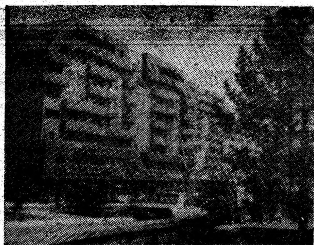
Verticale ale esteticului urban, în reședința de municipiu.

23 de ani de la Congresul al IX-lea al partidului