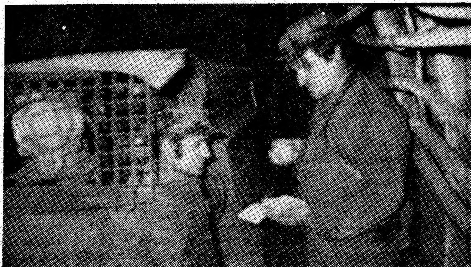
La mina Paroșeni, garniturile de vagonete cu cărbune sînt îndrumate și ficate cu multă atenție.