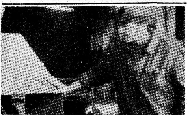
Aspect din preparația cărbunului Uricani.

ran, plasarea este optimă, pe toate schimburile, la toate lucrările. Iar la suprafață, în cariere, există, de asemenea, în prezent, efectivul planificat pe structuri de meserii. Înalta răspundere muncitorească dovedită în realizarea sarcinilor de plan reprezintă o consecință firească a bunei organizării activității, a îndeplinirii măsurilor stabilite de organizația de partid pentru creșterea producției și productivității muncii, pentru sporirea eficienței întregii activități.