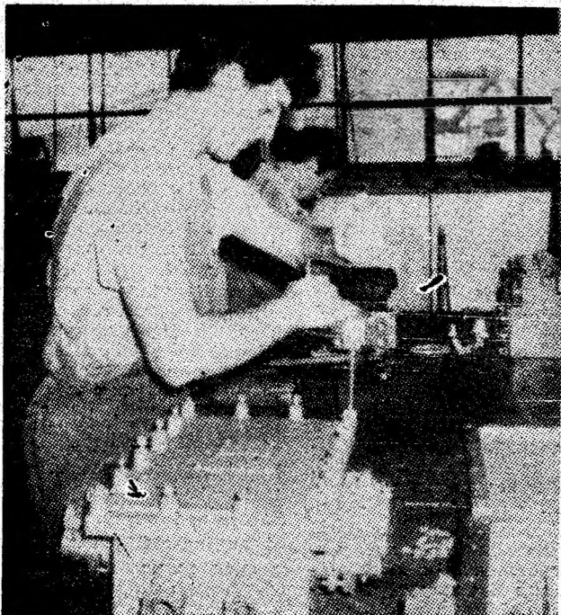
In secția de automatizări, din cadrul IUM Petroșani, se execută montajul final al cutiilor de ramificații-distribuție.

Nici sportul nu a fost uitat. Duminică, 7 august, de la ora 9, sînt programate pe stadionul „Minerul” finala Cupei „Minerul” la fotbal și o partidă amicală între Minerul Lupeni și FC Inter Sibiu, iar pe alte baze sportive, întreceri de cros, tenis de masă, judo, tenis de cîmp. (H. Dobrogeanu)