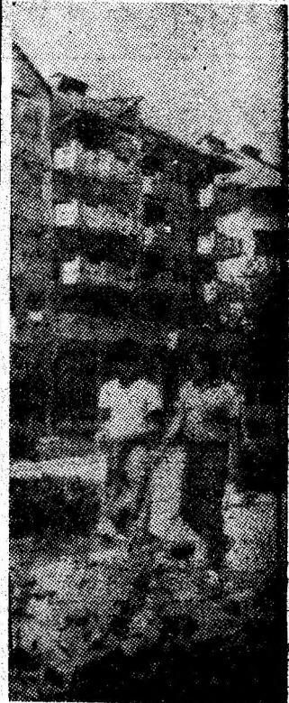
Petroșani, orașul reședință de municipiu în vestimentul verii și al înnoirilor edilitare.

Numai în ziua de 22 iulie, se purtasera de către organele de sindicat 62 de discuții individuale și 57 de către organele UTC din întreprindere cu cei ce absentează nemotivat. Între 1 octombrie 1987 și 1 august a.c. s-au purtat peste 3600 de discuții individuale, în majoritate cu nou încadrații. Care este însă eficiența acestor discuții individuale? Numărul nemotivatelor este încă mare. Asistăm la un fenomen de neintegrare? Nu. Dovadă afirmațiile interlocutorilor, dorința lor exprimată deschis, de a rămîne, de a se califica în minerit. Ce este de făcut? Discuțiile individuale amintite conduc la unele concluzii.