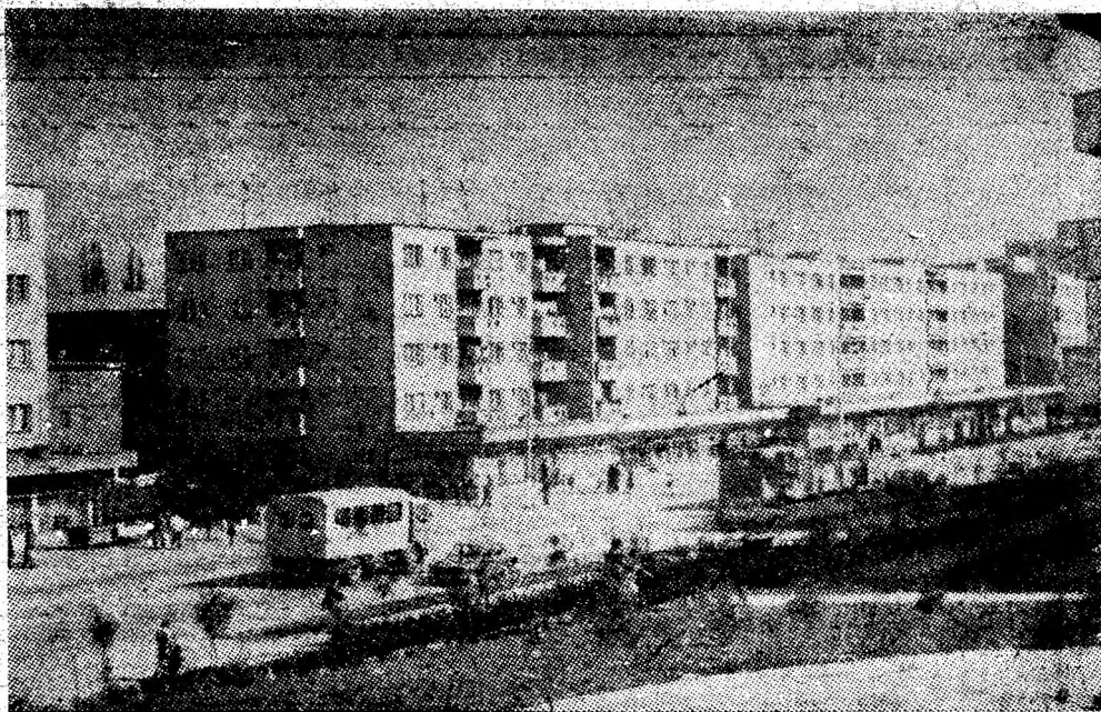
Vulcan — localitate înscrisă pregnant pe coordonatele modernizării edilitare.