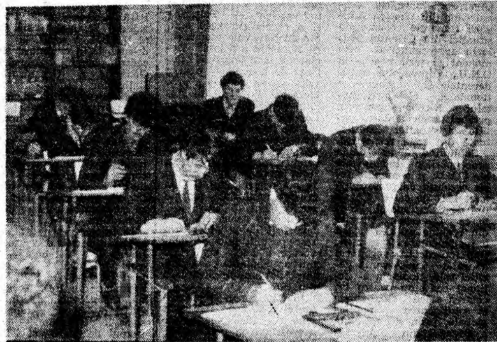
Studenții la planșete în timpul unei ore de la disciplina Geometrie descriptivă.

lui de instruire, educație și creație, fiind preocupat în permanență de restructurarea și modernizarea planurilor de învățămînt și a programelor analitice, de ridicarea la înalte cote științifice a cursurilor elaborate și predate pentru studenți, pentru continua creștere a eficienței practicei studențești, mai ales prin intensificarea și îmbunătățirea permanentă a procesului de integrare a învățămîntului cu cercetarea și producția. Ca urmare a muncii pline de responsabilitate desfășurată de cadrele didactice și studenți, sub direcția îndrumare a organelor și organizațiilor de partid, rezultatele profesionale din institutul nostru s-au materializat, an de an, prin