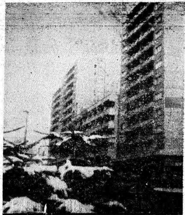
Prețutindenii în Valea Jiului, noul și modernul își fac simțită prezența.