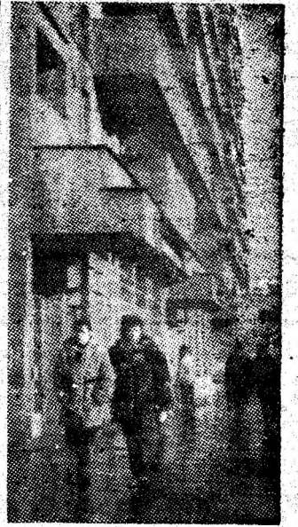
Vulcan - secvență citadină.

sociale pe baza dispariției deosebirelor dintre sat și oraș, a ridicării nivelului de pregătire profesională și tehnică. „Se va ajunge astfel - a arătat secretarul general al partidului - la realizarea poporului unic muncitor, animat de aceleași năzuințe și interese comune de a-și făuri în mod conștient viitorul liber și independent, de bunăstare și fericire, de a asigura deplina egalitate în drepturi și afirmarea principiilor de echitate și etică socialistă și comunistă, de ridicare necontenită a patriei noastre socialiste pe cele mai înalte culmi de progres și civilizație”.