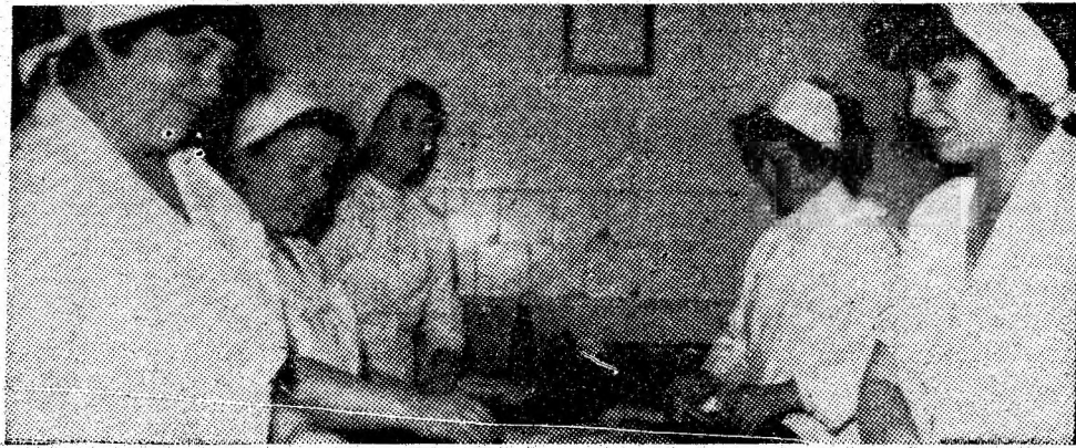
Imagine din secția de produse de panificație din Vulcan.

Refuzului automulțumirii i s-a adăugat — așa cum s-a desprins din climatul desfășurării dezbaterilor — hotărîrea unanimă de a îndeplini și chiar depăși angajamentele asumate în Chemarea la întrecere adresată către unitățile de extracție a cărbunelui din subteran. Cum atît de expresiv spunea unul dintre vorbitori — care a sintetizat, astfel, dorința comună a minerilor de la Paroșeni — a ține sus steagul de frunză însemnată a adăuga noi împliniri succeselor ce au adus faima acestui harnic colectiv de muncă din bazinul nostru carbonifer. Iar angajamentele luate în adunarea de minieri șefi de brigadă, de șefi de sectoare, de electrolăcăuși, de cadrele tehnice în numele și ca expresie a hotărîrii tovarășilor de muncă, nu fac altceva decît să ilustreze eforturile tuturor de a se întrece pe sine, de a sporta tradițiile și împlinirile minei-Erou.