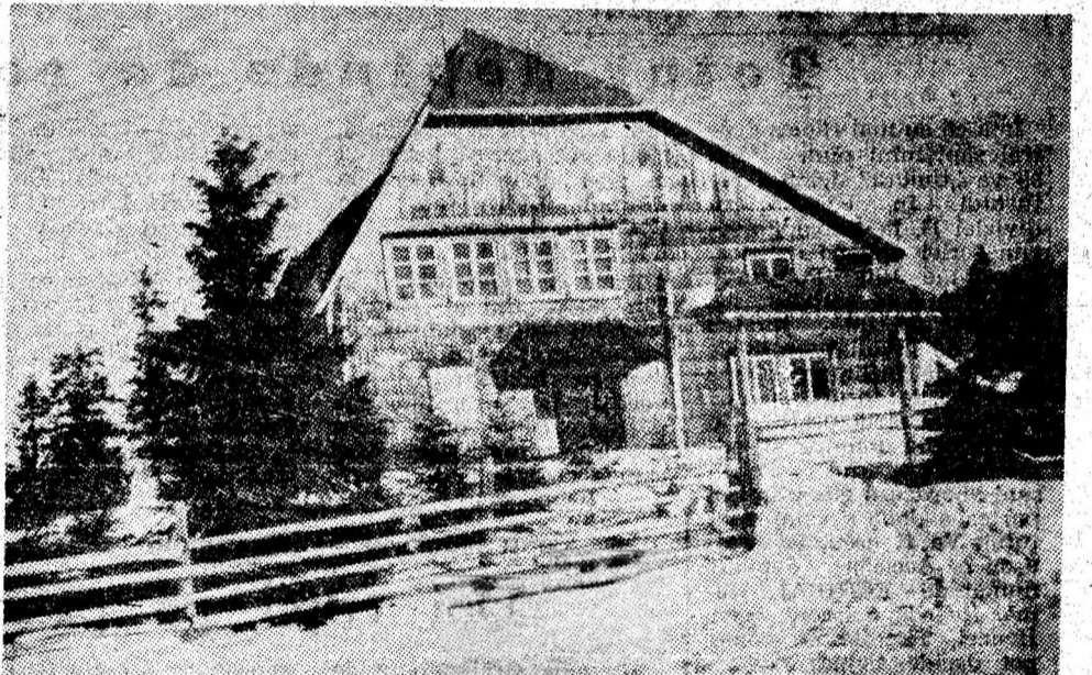
Căsuța din Povești — Parâng.

Oamenii de știință belgieni au obținut un nou sortiment de mase plastice, care are proprietatea de a „acumula” lumina în cursul zilei și de a degaja în întuneric, timp de trei-cinci ore. Noul material rezistă la apă și la acțiunea unor agenți corozivi. După cum se apreciază, el își va găsi o largă aplicabilitate în deosebi în construcția de avioane și nave.