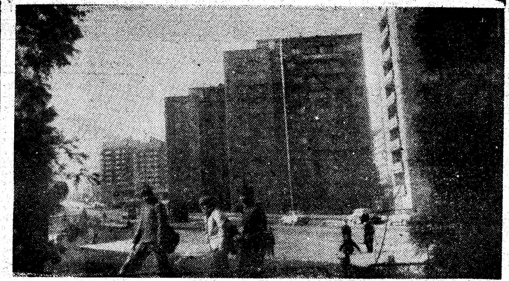
Secvență din Lupeni.

la funcționarea cu intermitență a fluxurilor tehnologice de preparare. Ciururile de preclărire, filtrele cu discuri de 40 mp, angrenajele de la ciururile tip WP sînt încă neomologate, nereușind, pînă în prezent, să atingem randamentele preconizate. Un alt aspect: benzile de evacuare a sterilului din spălătorie nefiind închise și acoperite, au înghețat în cursul anotimpului rece. Același lucru s-a întâmplat și cu benzile de insi-