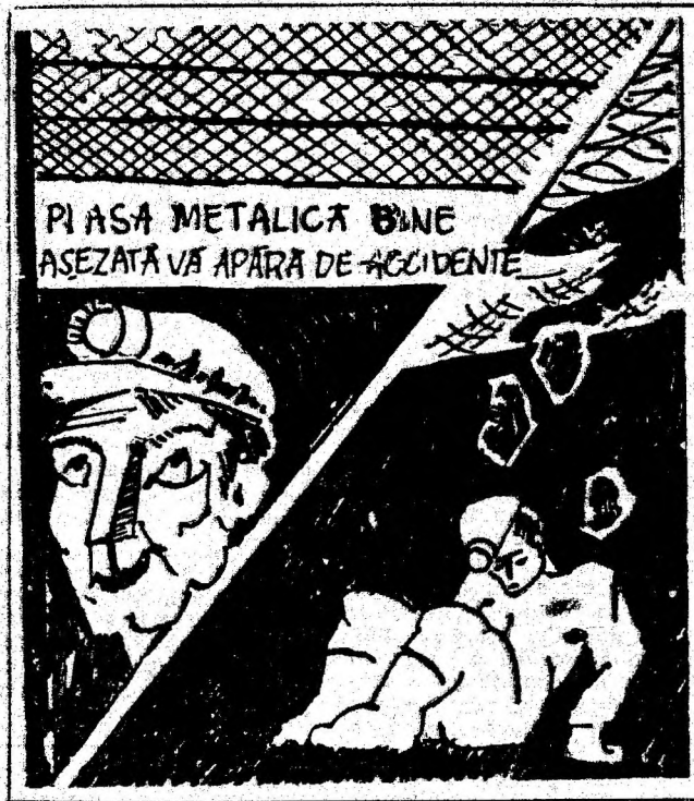
PLASA METALICĂ BINE AȘEZATĂ VA APĂRA DE ACCIDENTE

Inercind să fixeze un ax la stația de acționare a unui transportor TR-3, aferent abatajului frontal din stratul 13, blocul I, acesta a lovit puternic cu barosul steaua de acționare a transportorului. La o lovitură mai violentă din steaua de acționare s-a desprins o bucată de metal, care l-a accidentat la ochi.