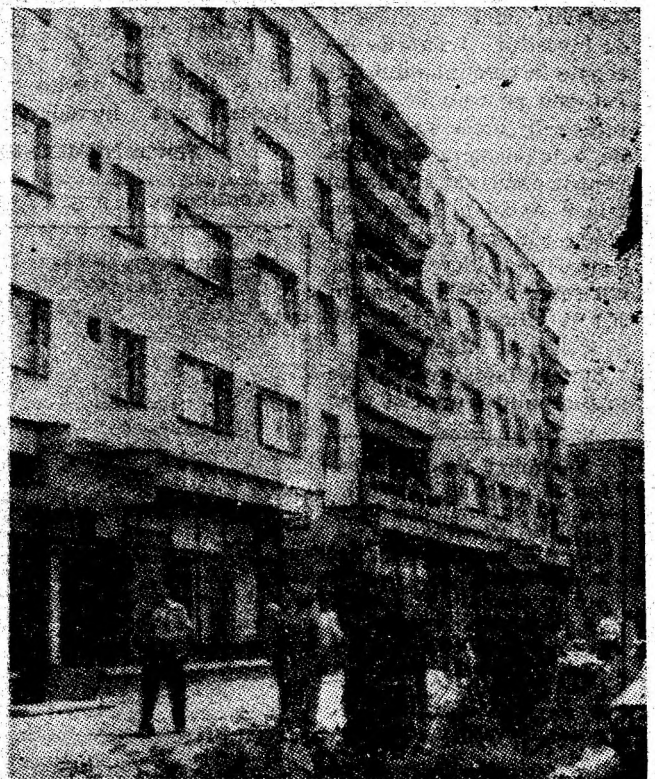
Uricani — secvență dintr-o zi de primăvară în cartierul Bucura.

Este un deziderat care în organizația de partid, în activitatea brigăzii IACMM din Petrila a devenit o realitate efectivă.