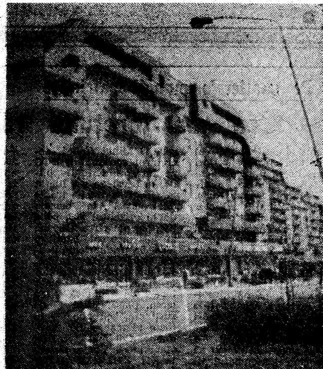
O zonă a Petroșaniului mereu prîmîniță de gospodăria săi: „Hermes”.

Ce trebuie făcut, ce se face în acest sens? Din datele care ni s-au furnizat la conducerea minei și comitetul de partid, re-