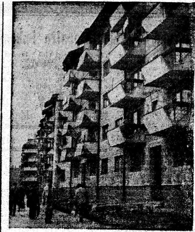
Verticale moderne în Petrolu.