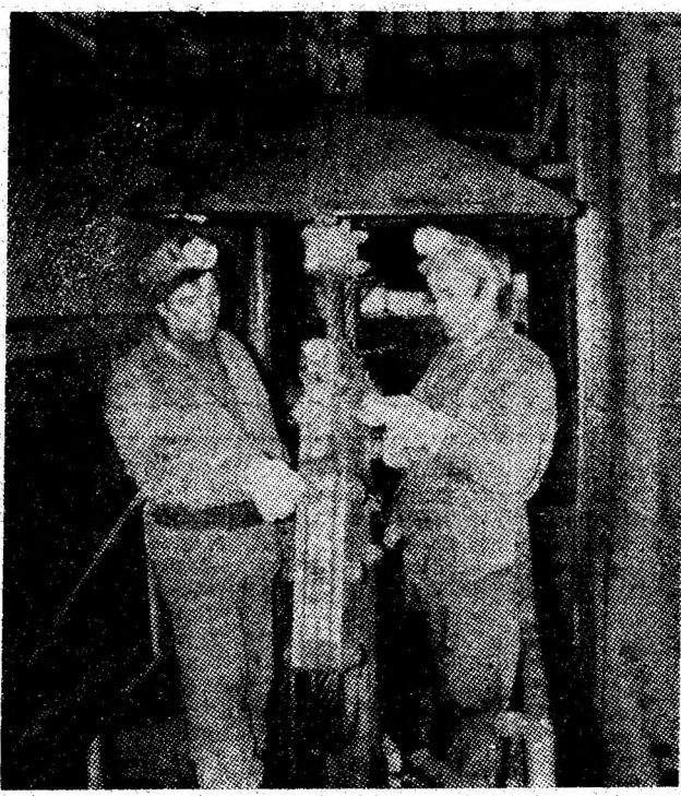
Executarea controlului siguranței la dispozitivul de prindere a cablului la instalația de extracție de la puțul auxiliar al minei Paroșeni. La lucru, echipa de revizie.