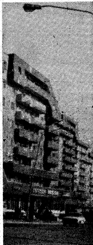
Verticale moderne în Petroșani.

După un demaraj „bun”, mina Uricani a început să înregistreze scăderea ritmului de extracție. Dincolo de orice alte cauze, creșterea absențelor denotă insuficiența implicare a comitetului de sindicat în îndeplinirea unor atribuții de însemnătate anamim recunoscută. Și, de ce să nu spunem, prin prisma formalismului care însoțește munca educativă a sindicatului își găsește răspunderi — destul de concrete — și comitetul de partid pe întreprindere!