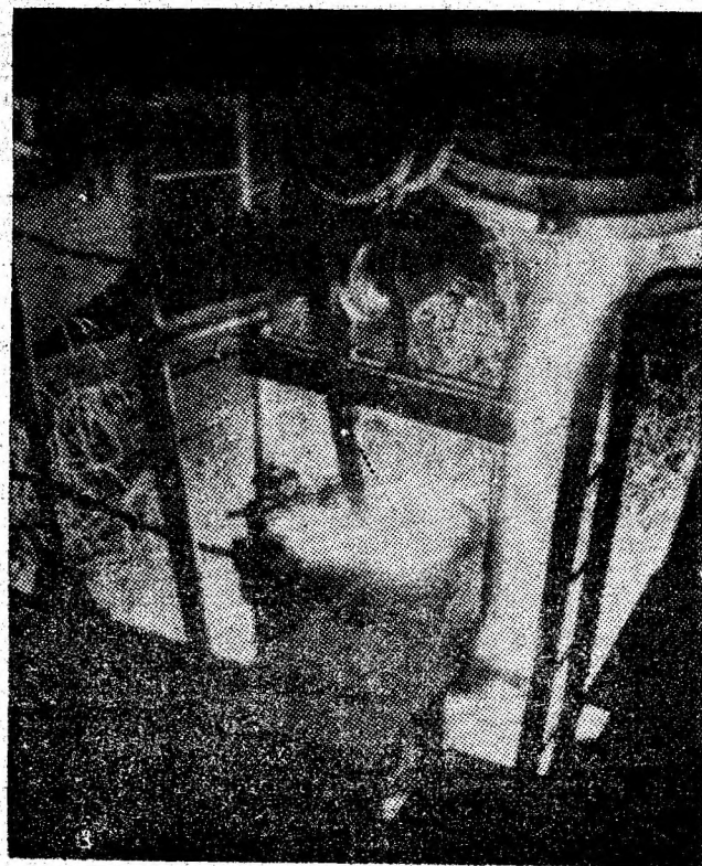
IUMP. În secția turnare se elaborează o nouă șarjă de oțel.

Investițiile - la termen, de calitate, eficiente