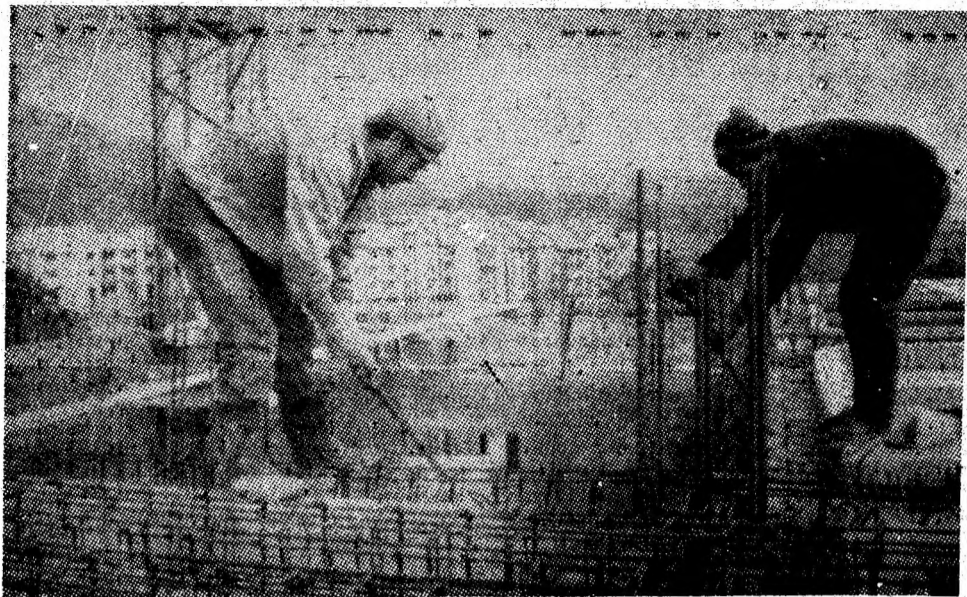
Echipa de fierari-betonisti din brigada 10 ACM Petroșani lucrează la structura de rezistență a blocului 26 de pe Bulevardul Republicii.