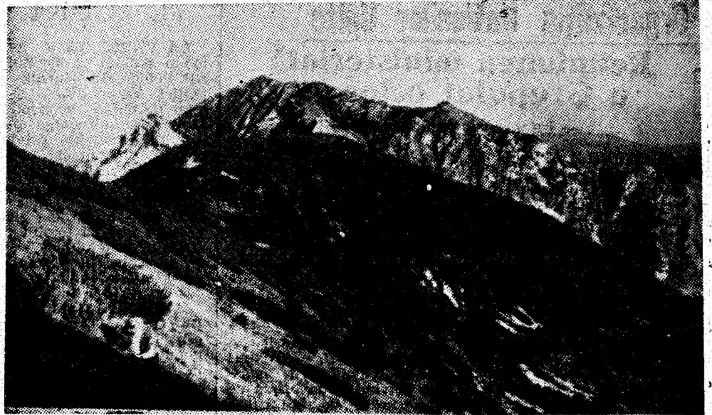
Căldarea Scorota și virful Piele din Retezatul Mic.

În viitor alte descoperiri de gen, și coroborarea acestora vor arunca lumini neașteptate asupra descoperirii de la Măgura. (V. MORARU)