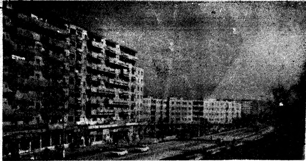
Arhitectonică modernă în Valea Jiului.