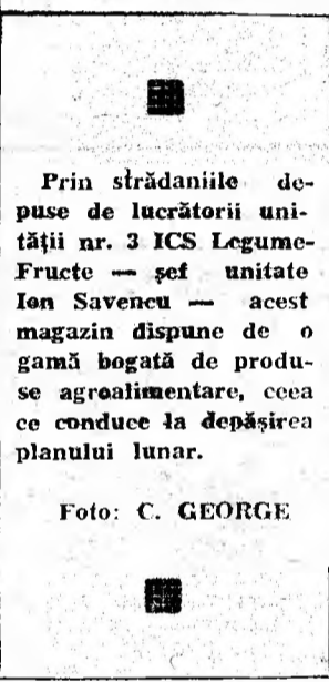
Prin strădaniile depuse de lucrătorii unității nr. 3 ICS Legume-Fruite — șef unitate Ion Savencu — acest magazin dispune de o gamă bogată de produse agroalimentare, ceea ce conduce la depășirea planului lunar.

Este un merit al întregii brigăzi, mai ales al minerilor șefi de schimb Eugen Diaconescu, Vasile Bălan, Victor Trifa, al com-