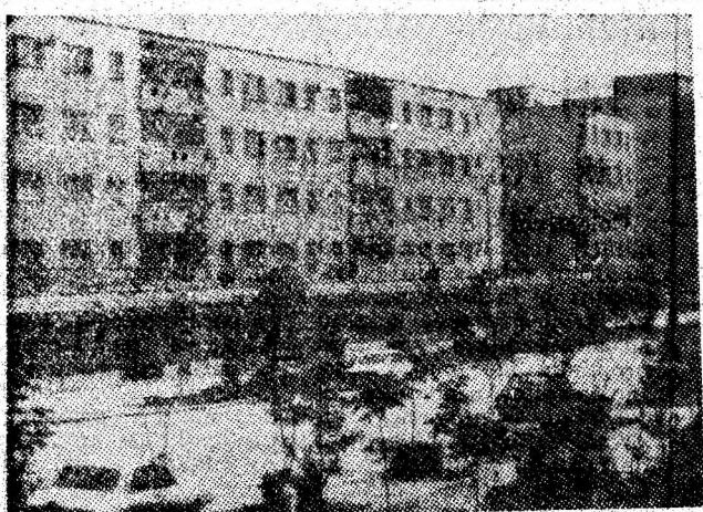
Vulcan, oraș în plină dezvoltare.