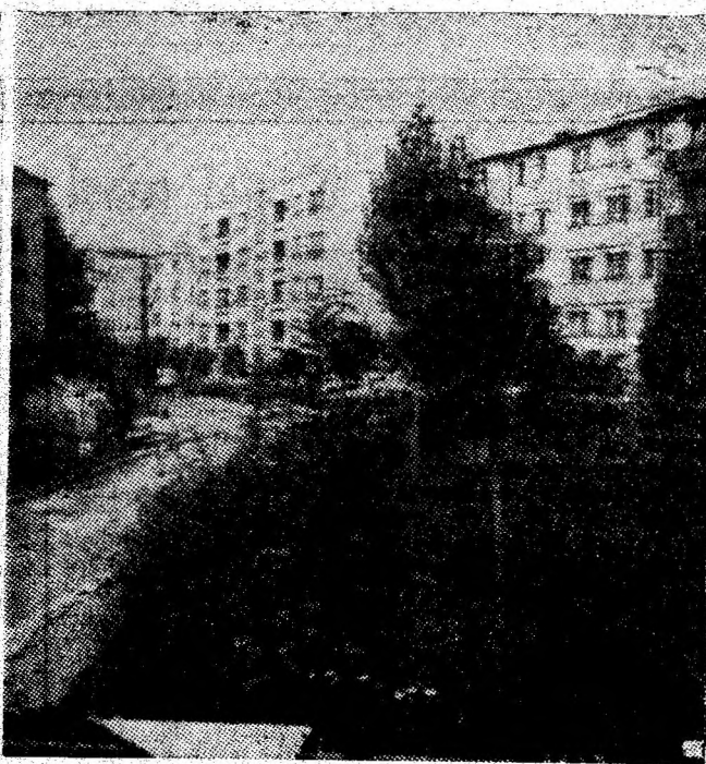
Secvență dintr-unul din modernele cartiere ale Lupeniului.