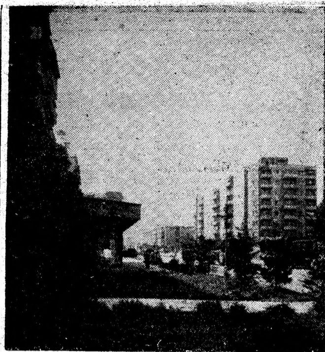
Lupeni — cartierul Bărbănteni.