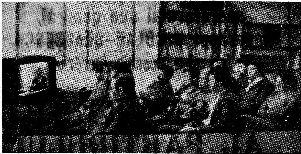
La IPSRUEEMP — interes deosebit față de desfășurarea lucrărilor Congresului al XIV-lea al partidului.

Remarcabilele rezultate obținute, cele care vor fi realizate în următoarea perioadă reprezintă pentru fiecare om al muncii din Valea Jiului, prinosul de recunoștință, înaltul omagiu pe care îl aduce partidului, secretarului general al partidului și mai ales dovada unanimei voințe a tuturor fiilor municipiului nostru de a susține în acest fel reafirmarea în suferința funcției de secretar general al partidului, a tovarășului Nicolae Ceaușescu, cel mai înflăcărat patriot și comunist al țării, care întruchipează cele mai înalte virtuți ale neamului nostru românesc, garanția sigură a înfăptuirii cu succes a importanțelor hotărâri ce vor fi adoptate la marele forum comunist, Congresul al XIV-lea al partidului, spre binele și bunăstarea întregului popor.