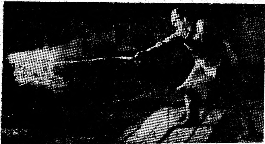
La gara captorului... Aspect din timpul elaborării unei noi șarje, din secția de elaborare și turnare a IUM Petroșani.