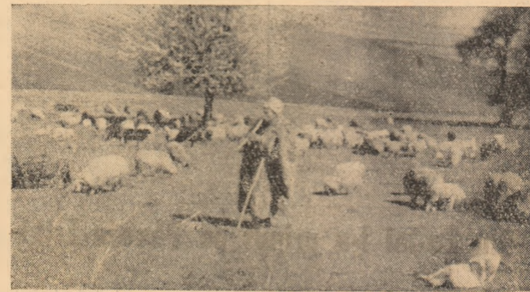
Oile gospodăriei colective din Oieșdea la pășune.

Sesiunea sfațului popular comunal poate și va trebui să-i ajute pe acești deputați, făcîndu-i să înțeleagă înalta lor menire de deputați.