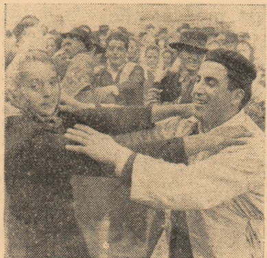
Așa a fost la Cistei: cîntec, joc și voie bună.