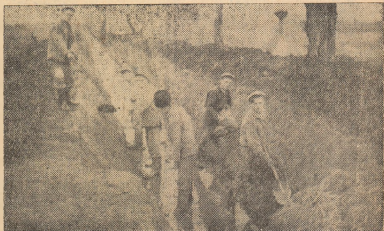
ÎN CLIȘEU: Executarea canalului principal pe pășunea „Rituri” din comuna Galda de Jos.