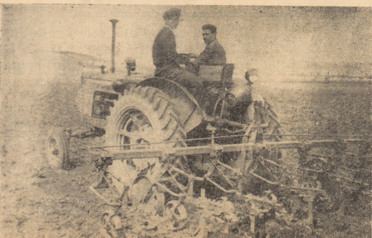
În clișeu: Prășitul mecanic la porumb — G.A.S. Galda de Jos.