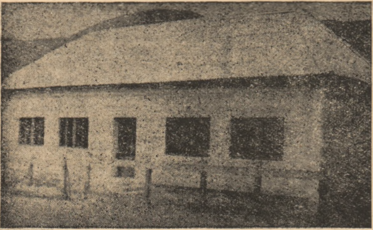
IN CLIȘEU: Noul local de școală din Poiana Ampoiiului.