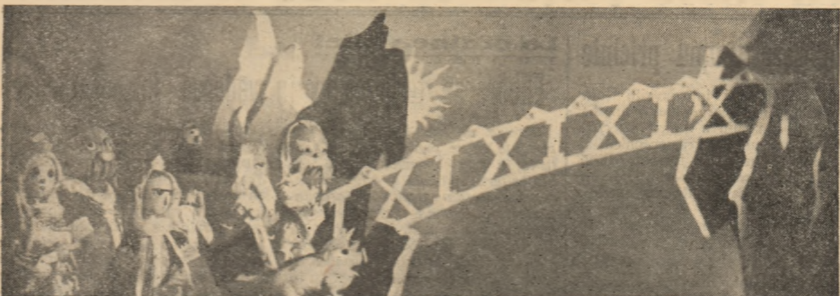
IN CLIȘEU: Aspect din tabloul III al piesei „Povestea porcului” prezentată de Teatrul de păpuși

La Vințul de Jos se pot și trebuie obținute succese mai mari în cooperativizarea agriculturii. E nevoie însă de o mai temeinică organizare a muncii politice, de mai multă preocupare din partea sfatului popular, a organizațiilor de partid din comună, pentru mobilizarea tuturor forțelor în munca de cooperativizarea comunei.