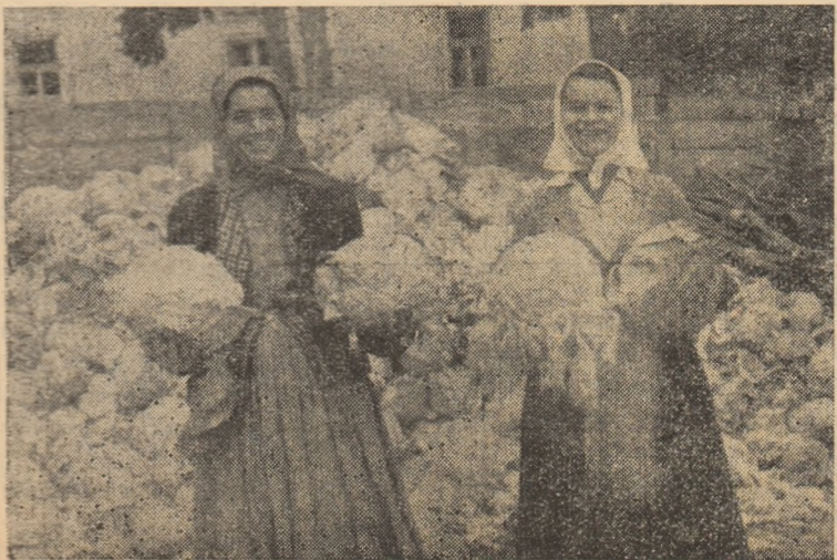
La G.A.C. Măcești recolta de varză este bogată.