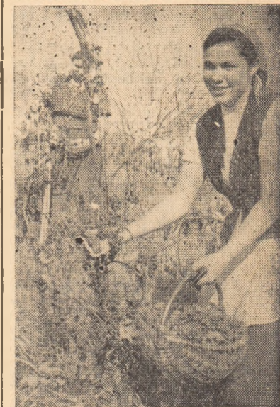
La G.A.S. Galda de Jos, recolta de struguri a fost bogată.

Față de această situație, conducerea cooperativei trebuie să ia cele mai potrivite măsuri care să ducă la impulsivarea preluării cerealelor contractate. Comitetul comunal de partid și sfatul popular din comună trebuie să îndrume și să controleze mai îndeaproape consiliul de conducere al cooperativei, să urgenceze preluarea produselor contractate. În această muncă este necesar să fie antrenați lucrătorii cooperativei și ai sfatului popular, cei mai buni agitari, deputați și repartizați pe sectoare, pentru a accelera preluarea produselor agricole.