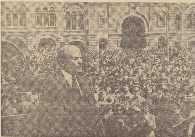
V. I. Lenin rostindu-și cuvîntarea în fața premilitarilor în Piața Roșie la Moscova, în ziua de 25 mai 1919.

Mărcața cauză a lui Lenin trăiește și învinge, însuflește milioane de oameni din toate colțurile pămîntului la lupta pentru pace, democrație și socialism.