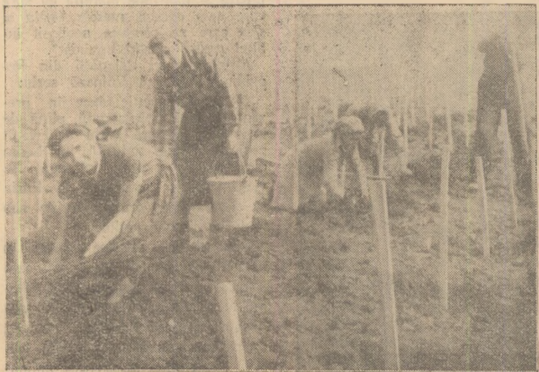
Plantatul viței de vie la G.A.S. Galda de Jos — trupu Stremț.

Critica cu îndrăzneală e iubită de oricine, numai unii șefi preferă critica cu... plecăciune.