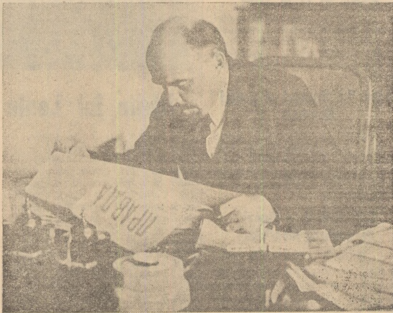
V. I. Lenin. 1918.

Podolskaia din Kișinău unde funcționa de asemenea o tipografie clandestină a „Iskrei”. Este expusă și o machetă a unei tipografii din Baku denumită conspirativ „Nina”.