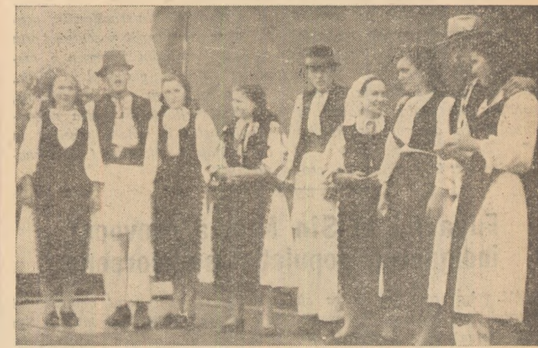
Deși tînără, brigada artistică de agitație din satul Șeușa a cîștigat simpatia întregului sat. IN CLISEU: Brigada în plin program.