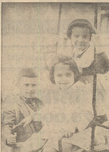
La căminul de zi din Alba-Iulia. Cu fețele pline de zîmbet copiii încearcă noile leagăne.

Soliștii vocali și restul formațiilor selecționate duminica ce a trecut se vor înfrînta în 24 iulie a.c. în etapa a II-a a concursului, ce va avea loc la Galda de Jos cu tinerii artiști amatori selecționați în concursuri similare ținute în restul comunelor din raion.