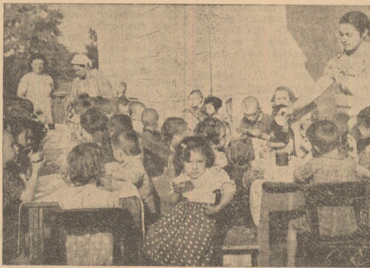
Micuții din Obreja iau gustarea de după amiază.

Lipsiți de griji, ca și părinții lor, copiii colectivștilor din Obreja simt din plin bucuriile copilăriei lor fericite. Și cresc. Cresc odată cu colectiva.