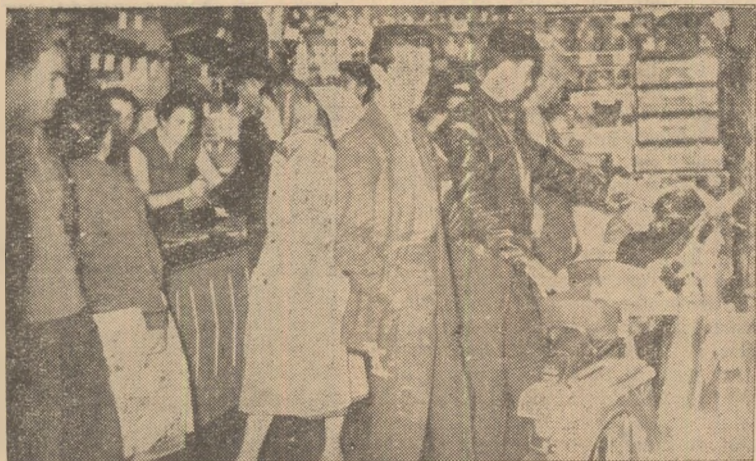
Noile reduceri de preţuri atrag tot mai mulţi cumpărători în magazine. IN CLISEU: După reducerea de preţuri în magazinul cu articole de sport din oraşul nostru.

Însufleţiţi de noile măsuri luate de partid şi guvern, oamenii muncii din raionul nostru, alături de toţi cei ce muncesc pe întinsul scumpei noastre patrii, se simt tot mai tari în lupta pentru traducerea în fapte a hotărîrilor partidului şi guvernului. Călăuză le sînt Directivele celui de-al III-lea Congres, iar îndrumător şi conducător pe drumul desăvîrşirii construcţiei socialiste în patria noastră le este puternicul şi încercatul partid, avangardă a clasei muncitoare din ţara noastră.