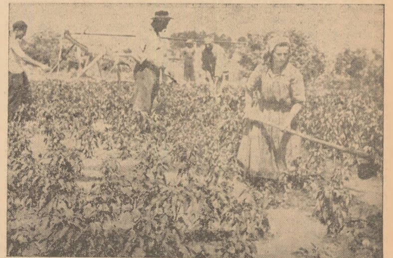
Colectiviștii din Mihalt acordă toată atenția lucrărilor de întreținere la grădina de legume. ÎN CLÎȘEU: Irigarea culturii de ardei.

★ Intr-una din sălile Casei raionale de cultură a fost deschisă de către Consiliul raional A.R.L.U.S. expoziția „Caricaturii sovietici au cuvîntul”.