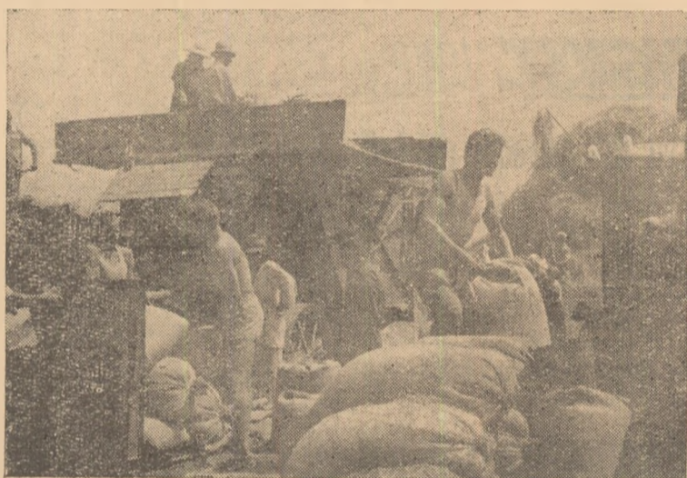
Treierişul la G.A.C. — Ighiu