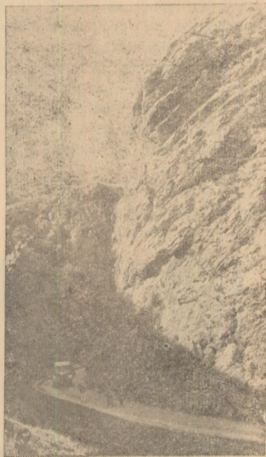
Pe drumul nou construit, sătenii din comuna Intregalde, circulă cu ușurință spre așezările de șes.

În prezent, muncitorii atelierului execută reparații și amenajări la pivnițele de depozitare a vinului din Ighiu și Cetate—Alba-Iulia. Ca de altfel peste tot unde muncesc acești oameni, rezultatele muncii lor sînt îmbucurătoare. Nu peste mult timp, datorită eforturilor depuse de acest harnic colectiv, cele două pivnițe vor fi gata înainte de termenul fixat pentru a primi noua recoltă.