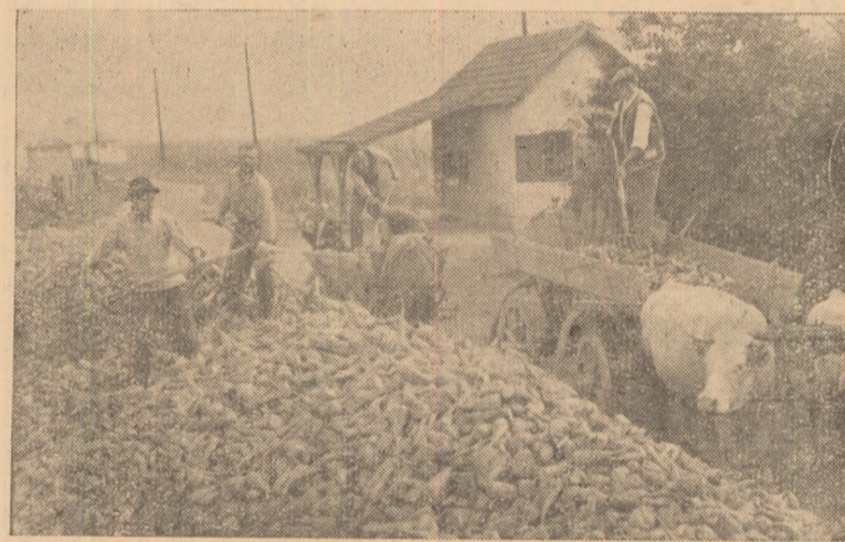
Colectivisti din Galda de Jos au obținut o recoltă bogată de sfeclă. ÎN CLIȘEU: predarea sfeclii de zahăr la stația de expediere.

Dat fiind că epoca optimă de însămînțat este acuma, și orice întârziere poate avea drept urmare diminuarea producției la hectar, datoria organizațiilor de partid și a comitetului executiv al sflatului popular din comuna Hăpria este de a îndruma întovărășirile din satele comunci să asigure în timpul cel mai scurt condiționarea și tratarea semințelor, să le ajute să-și procure semăntorile necesare și să însămînțeze din plin.