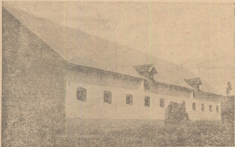
IN CLIȘIU: Grajdul din G.A.C. — Berghin construit de curînd.

Depunînd tot efortul pentru terminarea într-un timp cât mai scurt a construcțiilor de grajduri în gospodăriile colective, puterea economică a acestora și bunăstarea colectivității va crește tot mai mult.