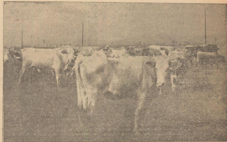
IN CLIȘEU: O parte din vacile G.A.C. — Teiuș.

„SCÎNTEIA“ va apare și luni De două ori pe săptămînă ziarul va apare în 6 pagini