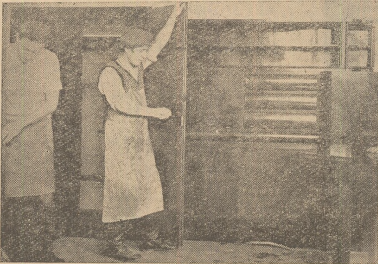
IN CLISEU: Lucrări de finisaj la una din garniturile de mobilă lustruită, executată de I.I.L. „Horia” Alba-Iulia.