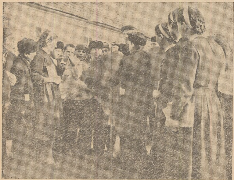
IN CLISEU: Elevii din anul II al școlii profesionale de zootehnie din Galtiu, la o oră de lucrări practice.