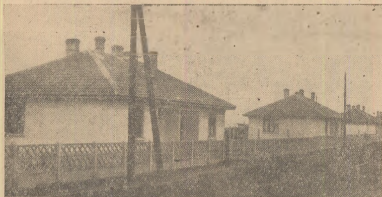
În CLIȘEU: Locuințe muncitorești — Stația C.F.R. — Coșlariu.

Avînd sămînța condiționată și tratată din vreme și timpul fiind prielnic, colectivitățile au început însămînțările. Pînă la 2 martie, ei au însămînțat orzul pe întreaga suprafață planificată și au început însămînțarea ovăzului. Totodată, se continuă cu întreținerea arăturilor de toamnă.