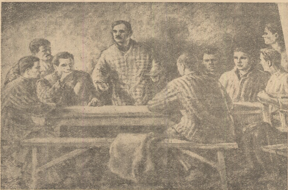
Conferința celei de partid din Doftana (1938) — desen de N. Vlădescu (reproducere de la Muzeul de Istorie a Partidului)

fășurat o intensă muncă de organizare a luptei revoluționare a maselor muncitoare pentru respingerea ofensivei claselor exploatare contra nivelului lor de trai, pentru apărarea independenței naționale a patriei, pentru a bara calea fascismului și războiului antisovietic.