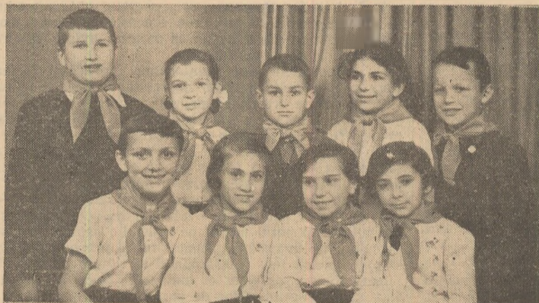
Promoția de pionieri „A 40-a aniversare a partidului” — Școala de 7 ani Nr. 1 Alba-Iulia.