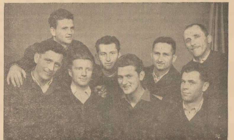
Un grup de comunisti de la U.M.C. Zlatna — fruntași în producție.

Bilanțul întrecerii încheiat la sfîrșitul primelor 4 luni din acest an este deosebit de rodnic. Prin efortul unanim al colectivului unității, planul de producție a fost depășit cu 7,83 la sută, iar combustibilul convențional economisit pe această perioadă se ridică la 1.106,2 tone.