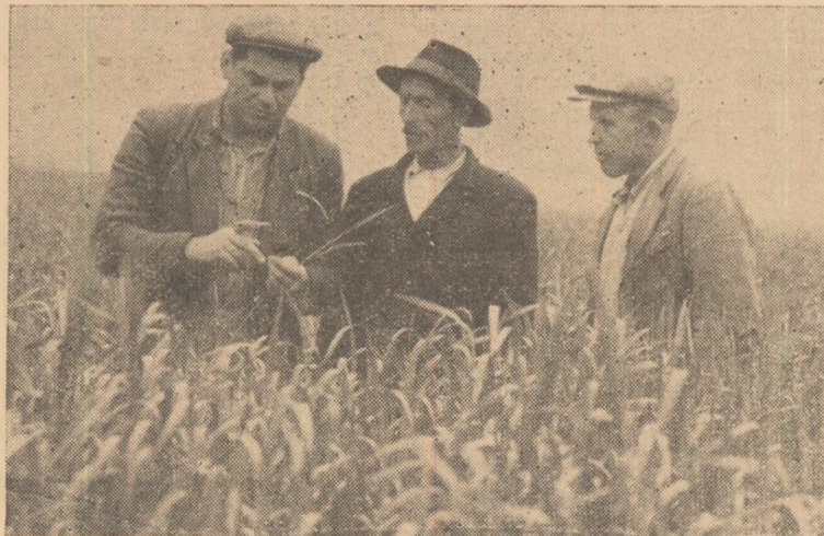
Controlul stadiului de dezvoltare a culturii de grîu la G.A.C. Alexandru Petofi — Oicjdea.

În continuare, la această unitate se dă bătălia pentru a termina cît mai degrabă prima prașilă la porumbul pentru boabe și pentru siloz.