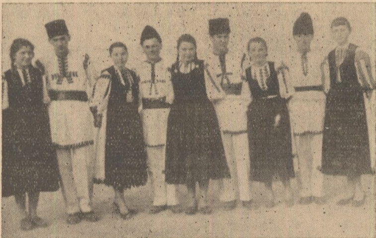
Echipa de dansuri a căminului cultural din Cricău.