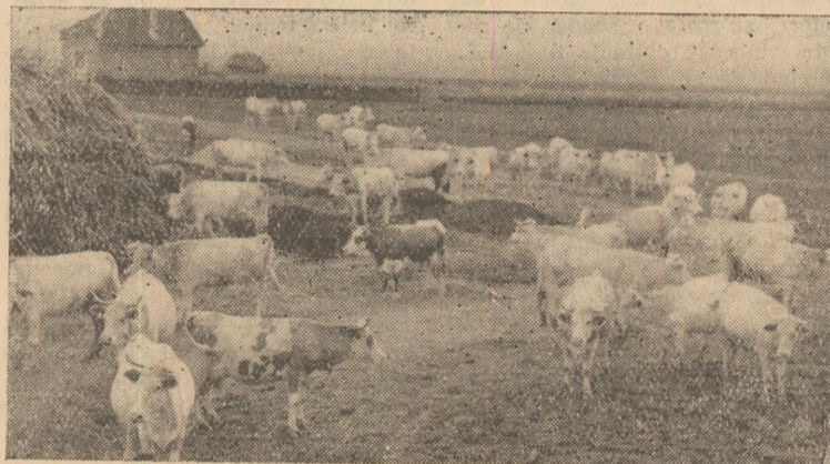
O parte din vacile gospodăriei colective din Mihalt.