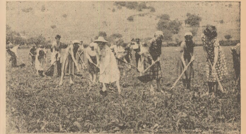
Muncă patriotică la prășitul porumbului — G.A.C. „Unirea” A. Iulia. ÎN CLIȘEU: Un grup de elevi de la Școala medie H.C.C. la prășit.

Față de asemenea situație, dăunătoare producției viticole, consiliul de conducere al gospodăriei, sprijinit cu toată răspunderea de sfatul popular din comună, trebuie să ia cele mai potrivite măsuri pentru a efectua la zi lucrările în viile gospodăriei.