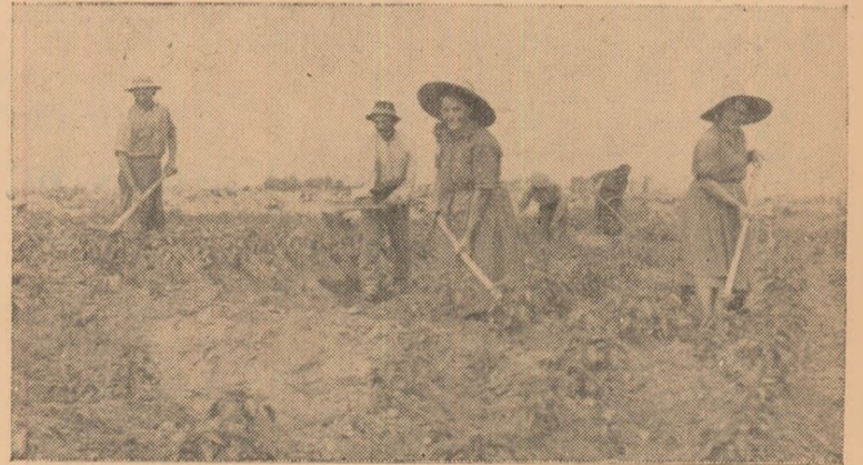
Paralel cu secerișul, colectivștii din Mihalț continuă și lucrările de întreținere la grădina de legume.

buie să ia toate măsurile pentru ca terminarea reparațiilor la utilajul necesar la treierie, precum și pregătirea spațiului pentru depozitarea seminței să se facă în cel mai scurt timp.