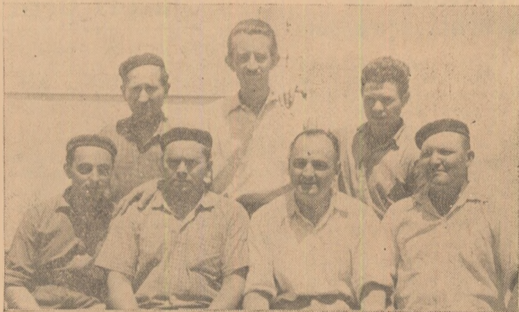
Un grup de muncitori fruntași de la I. G. O. Alba Iulia.