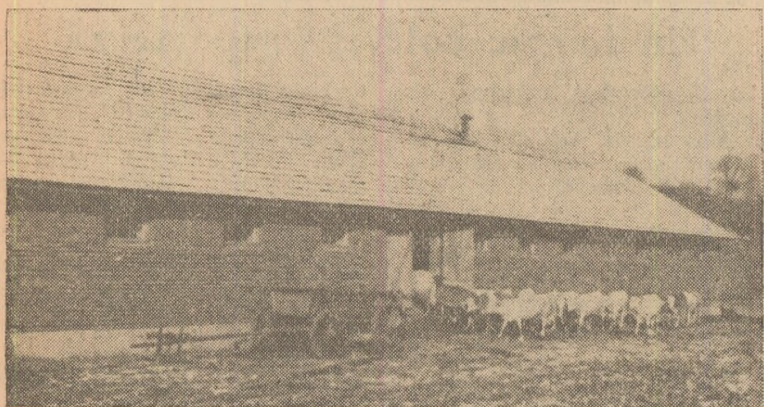
Grajdul pentru 100 bovine construit în acest an.

KAST MARTIN vicepreședinte G.A.C. Berghin