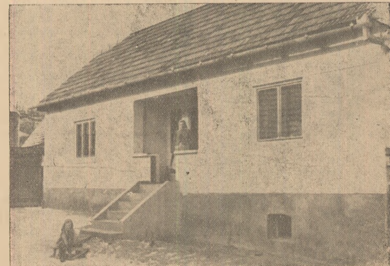
Casa nouă a colectivității Kast Martin Pruscai