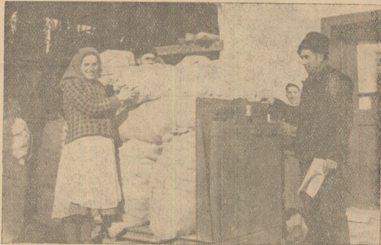
Recolta bună obținută în acest an de colectivității din Berghin, a dat posibilitatea acestora să împartă la zi-muncă importante cantități de cereale și sume însemnate de bani.

Convinși din experiența proprie de veniturile mari ce se obțin prin dezvoltarea sectorului zootehnic, colectivității și-au prevăzut ca în anul viitor să sporească numărul de vaci la 105 capete, la 190 pe cel al vițelilor și la 1.000 de capete pe cel al oilor. Totodată și-au propus să asigure o matcă de 50 scroafe de prăsilă și să crească 1.000 de păsări. Prin lărgirea sectorului zootehnic, în anul viitor acest sector va aduce colectivităților din Berghin un venit de peste 400.000 lei.