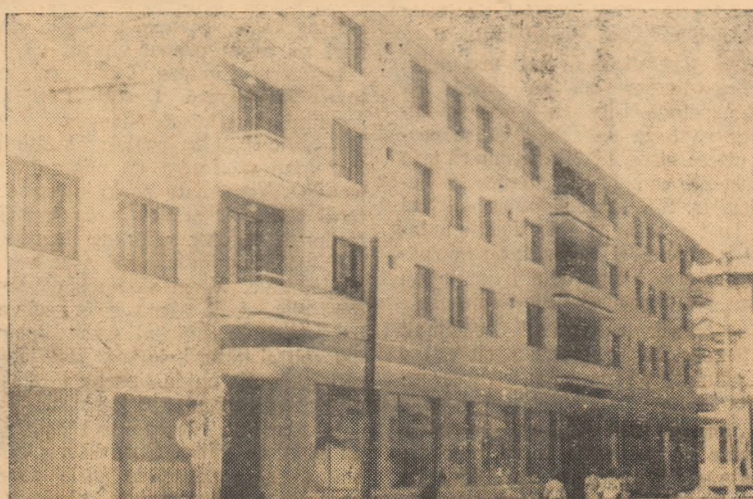
La Alba Iulia a fost terminată construcția blocului din centrul orașului