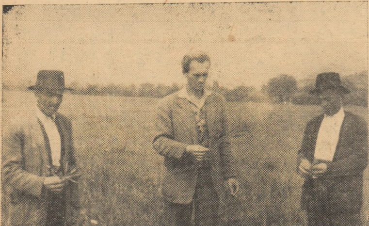
IN CLIȘEU: Se verifică rezultatele combaterii cu erbicide a buruienilor din cultura de grâu.