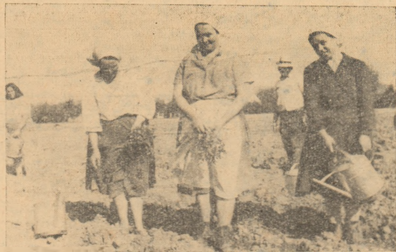
Colectivității din Bărbant lucrează de zor la plantatul roșiilor

Situații asemănătoare în ce privește construcțiile școlare stăruie apoi și în alte părți din raionul nostru. La Bărbant, sumele necesare sînt strîns, documentația întocmită și cetățenii gata să participe la muncă. Statul popular al orașului Alba Iulia însă tărăgănează începerea lucrărilor, același lucru fiind valabil la adresa sfatului și în ce privește construcția sălii de clasă