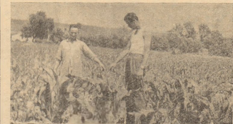
ÎN CLIȘEU: La G.A.C. Streiș. Se controlează starea porumbului de 5.000 kg la ha.

La baza acestor succese de seamă a stat desfășurarea unei entuziaste întreceri socialiste, a stat