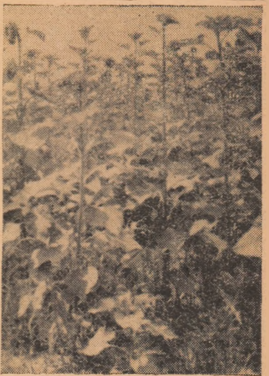
Bine îngrijită de colectivștii din Coșlariu, cultura de floarea-soarelui s-a dezvoltat frumos, ajungînd la stadiul de înflorire.